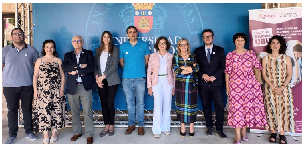
Ilustración 1: Junta Directiva Alumni UBU 2025-2029